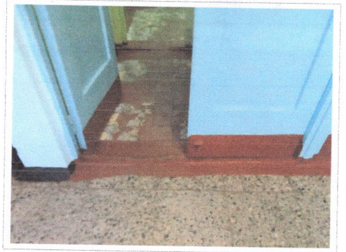
Фото 11 Входная дверь внутренняя