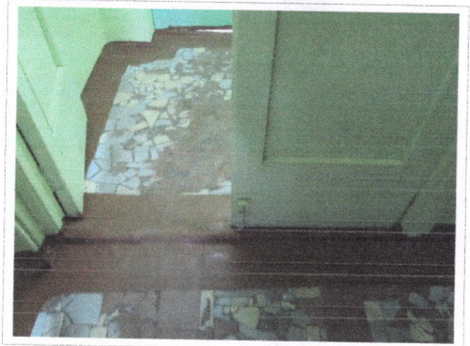
Фото 9 Входная дверь межтамбурная