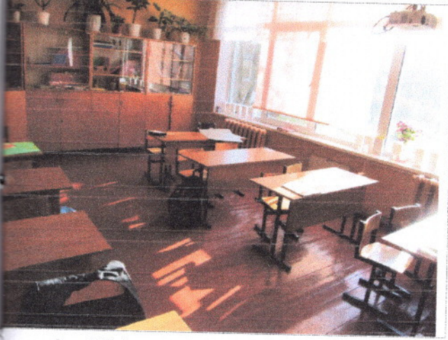
Фото 26 Кабинетная форма обслуживания (классы)