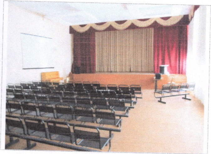
Фото 25 Зальная форма обслуживания (актовый зал)