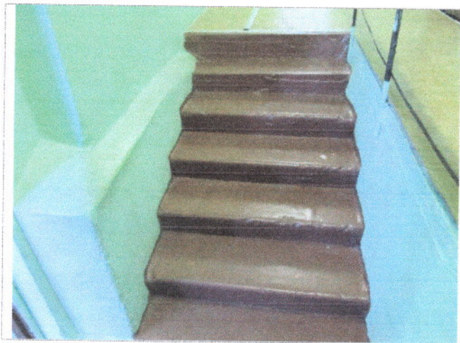
Фото 19 Внутренние лестницы.