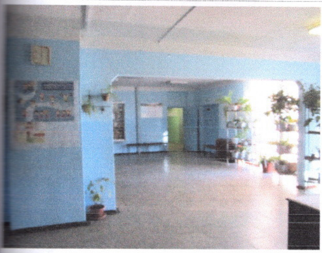
Фото 12 Коридор (вестибюль, зона ожидания, галерея, балкон)