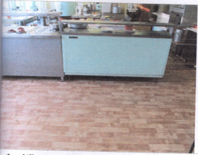
Фото 24 Прилавочная форма обслуживания (столовая, раздача)