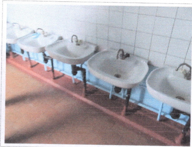
Фото 31 Раковины у столовой зоны