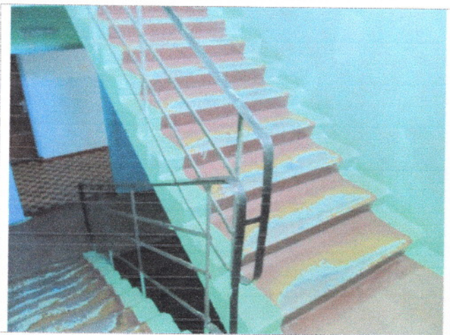
Фото 21 Внутренние лестницы (междуэтажные)