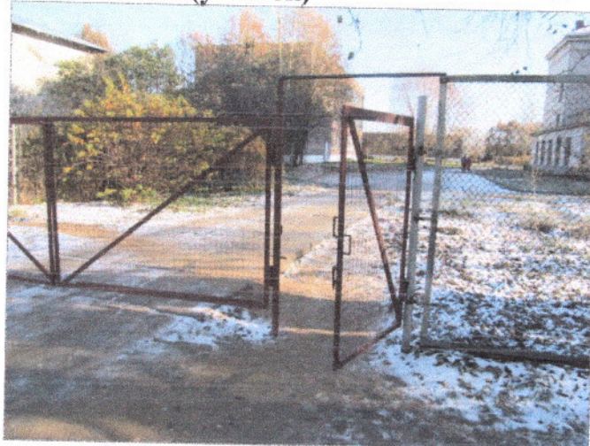
Фото 2 Путь (пути) движения на прилегающей территории (калитка)