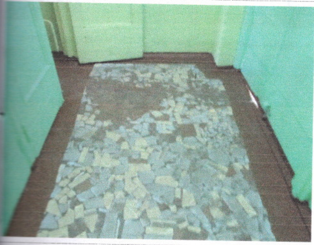
Фото 8 Тамбур №1