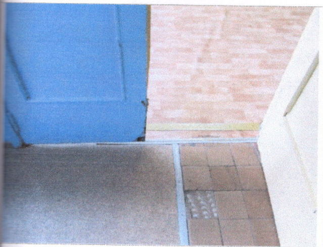
Фото 18 Внутренние двери.