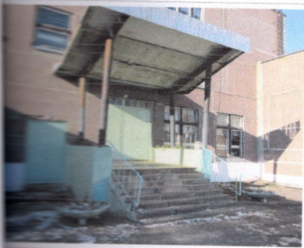
Фото 4 Входная площадка