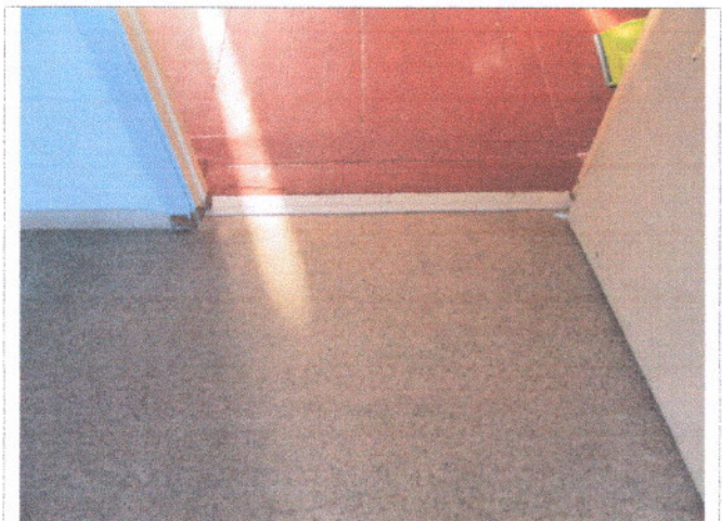
Фото 15 Внутренние двери