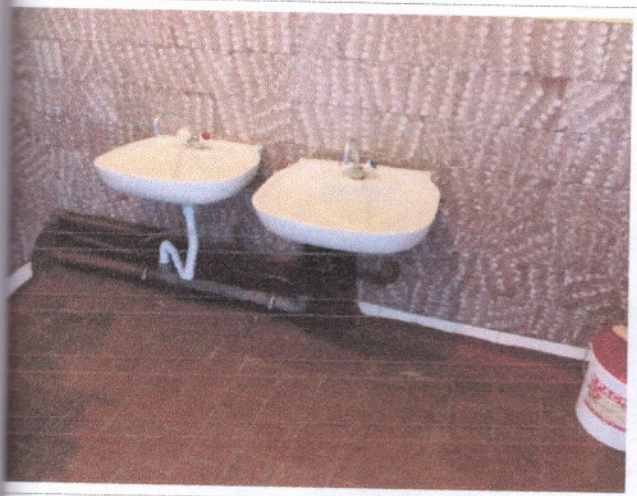
Фото 30 Туалетная комната (раковины)