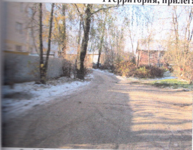
Фото 1 Путь (пути) движения на прилегающей территории