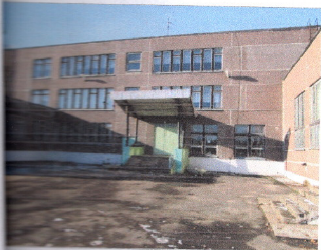
Фото 3 Путь (пути) движения на прилегающей территории