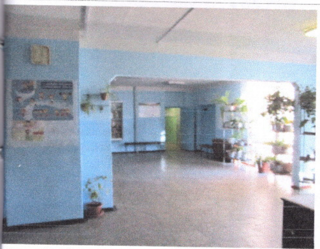
Фото 32 Визуальные средства