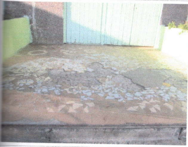
Фото 6 Входная площадка.