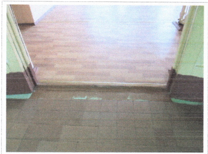
Фото 13 Внутренние двери