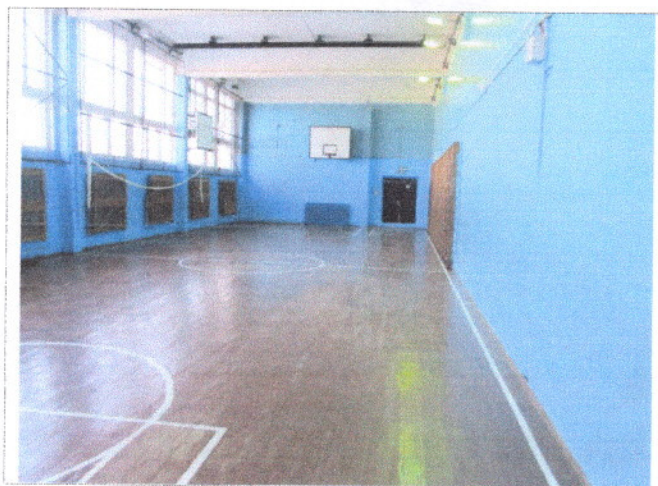
Фото 23 Зальная форма обслуживания (спортивный зал)