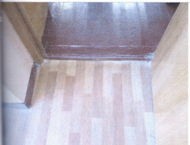
Фото 16 Внутренние двери.