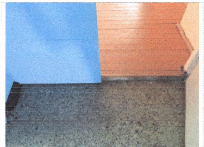
Фото 17 Внутренние двери.