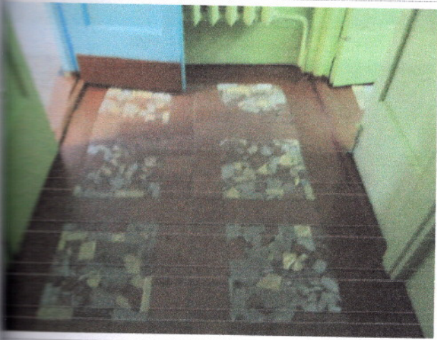
Фото 10 Тамбур №2