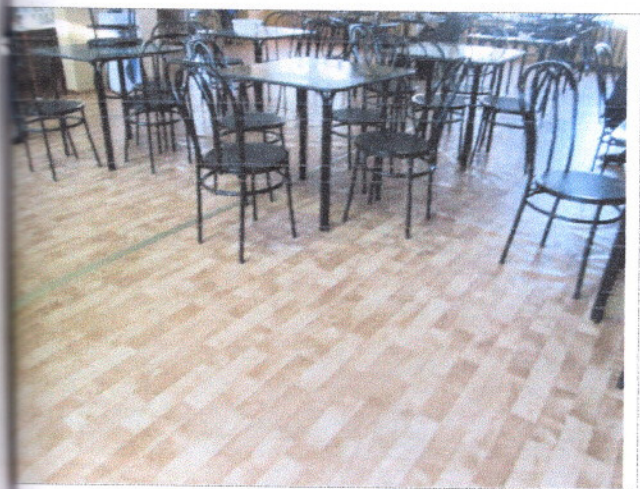
Фото 22 Зальная форма обслуживания (столовая)