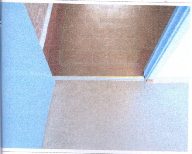
Фото 28 Санитарный узел (дверь)