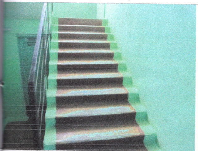
Фото 20 Внутренние лестницы (междуэтажные)