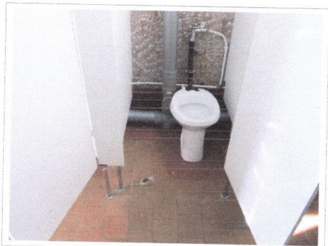
Фото 29 Туалетная комната (дверь, унитаз, кабина)