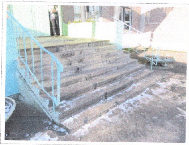
Фото 5 Входная лестница (наружная).