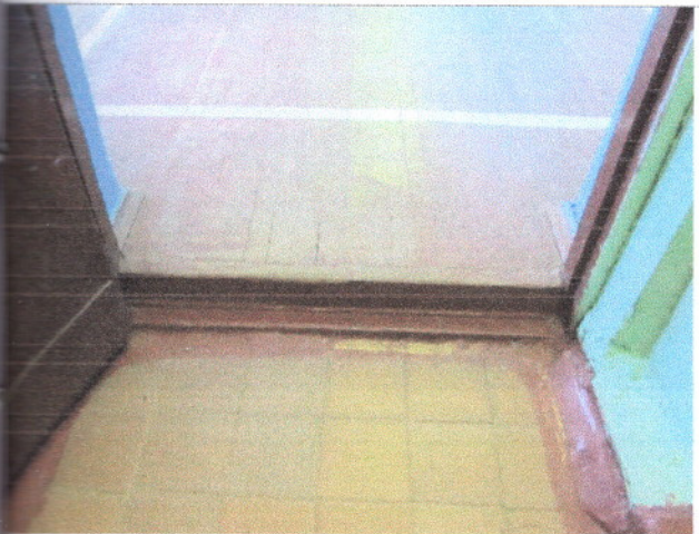
Фото 14 Внутренние двери