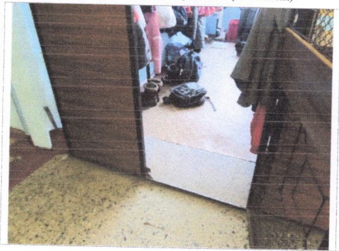
Фото 27 Гардероб