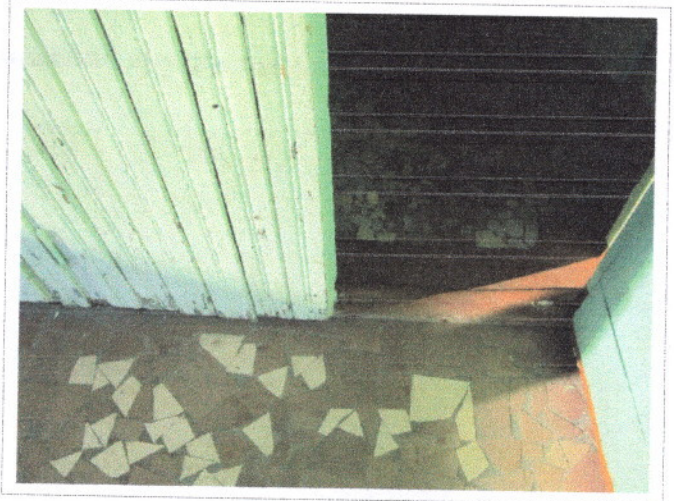
Фото 7 Входная дверь внешняя.